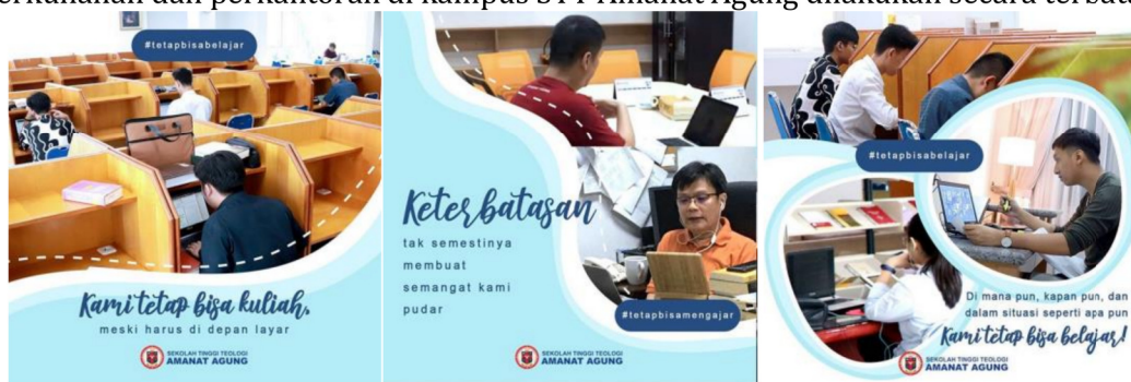
Gambar 30: Pembatasan sosial di STTAA