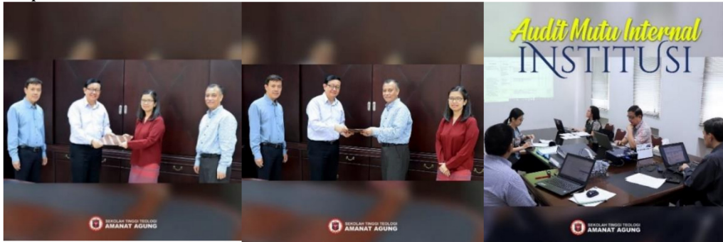
Gambar 11: Audit Mutu Internal

23 September 2019, telah dilakukan Audit Mutu Internal Institusi.