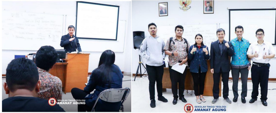
Gambar 18: Emmaus Center