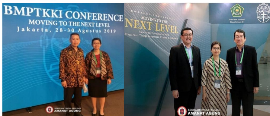
Gambar 22: Badan Musyawarah Perguruan Tinggi Keagamaan Kristen di Indonesia