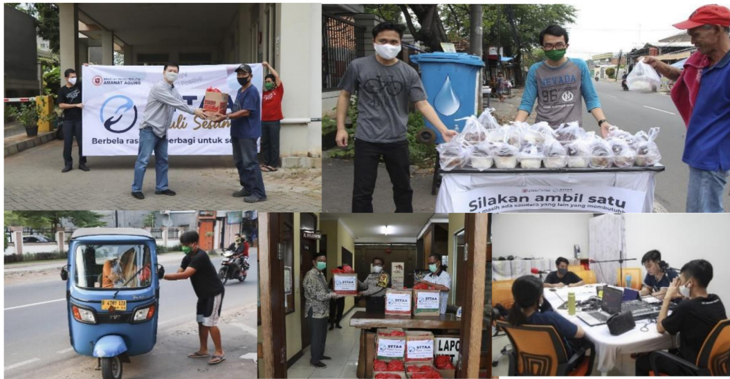
Gambar 31: Kegiatan STTAA Peduli Sesama