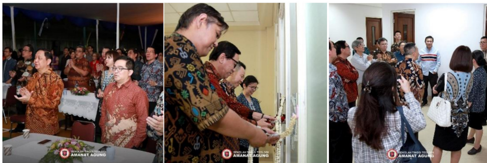
Gambar 24: Ibadah Syukur dan Kebersamaan dengan Sahabat STTAA