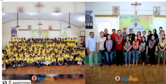
Gambar 12: Retreat Remaja Kupang dengan tema "Finding Love"