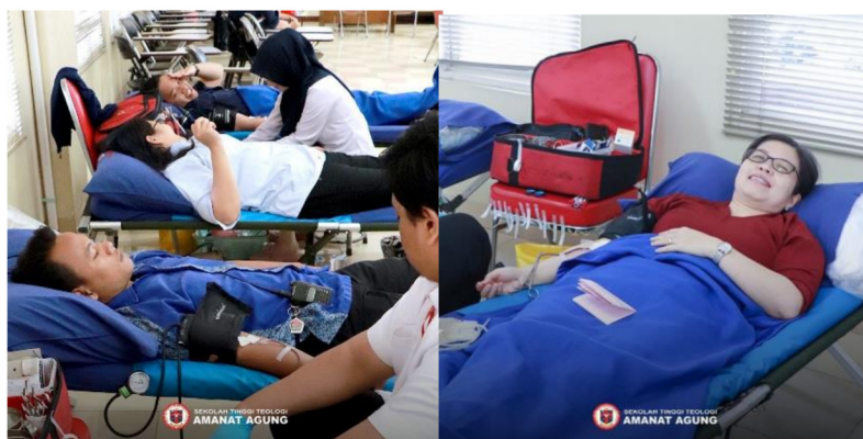
Gambar 10: Donor Darah