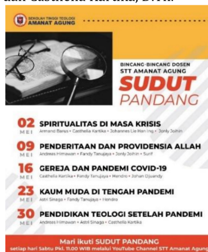
Gambar 32: Acara Sudut Pandang STT Amanat Agung