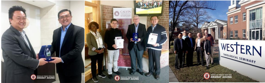
Gambar 23: Kunjungan ke Western Theological Seminary dan ke Calvin Theological Seminary, USA.