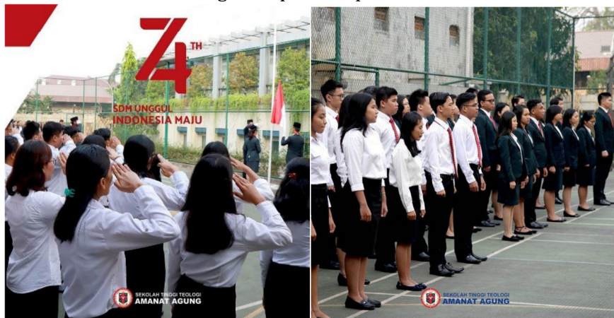
Gambar 6: HUT RI ke 74