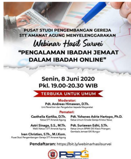
Gambar 33: Webinar Hasil Survei “Pengalaman Ibadah Jemaat dalam Ibadah Online”