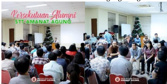
Gambar 29: Persekutuan Alumni