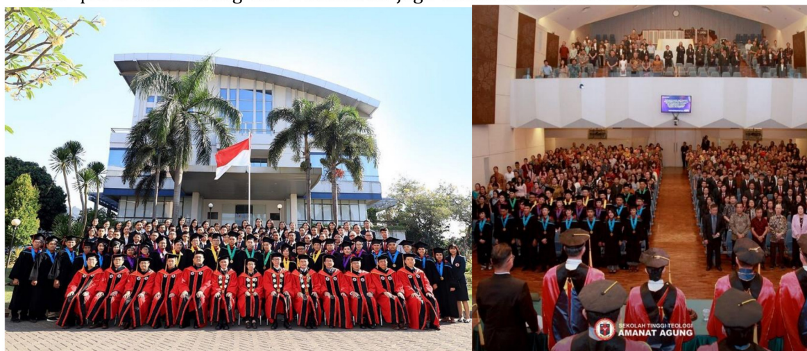
Gambar 5: Wisuda dan Dies Natalis ke-22