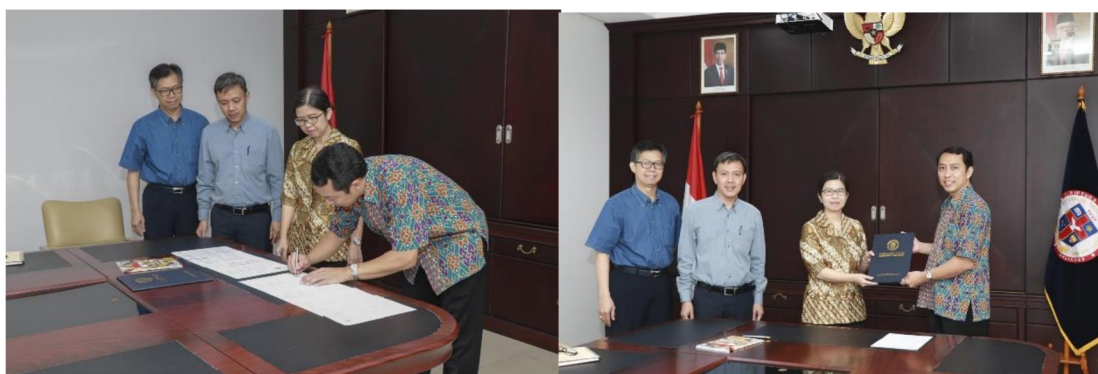
Gambar 28: Penandatanganan MoU dengan ACSI