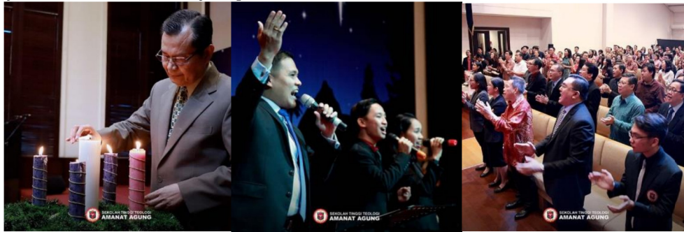
Gambar 2: Ibadah Natal dan Penutupan Semester Ganjil Tahun Akademik 2019-2020