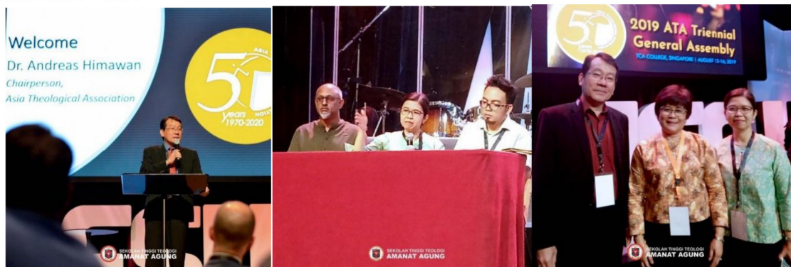
Gambar 21 : 2019 ATA Triennial General Assembly