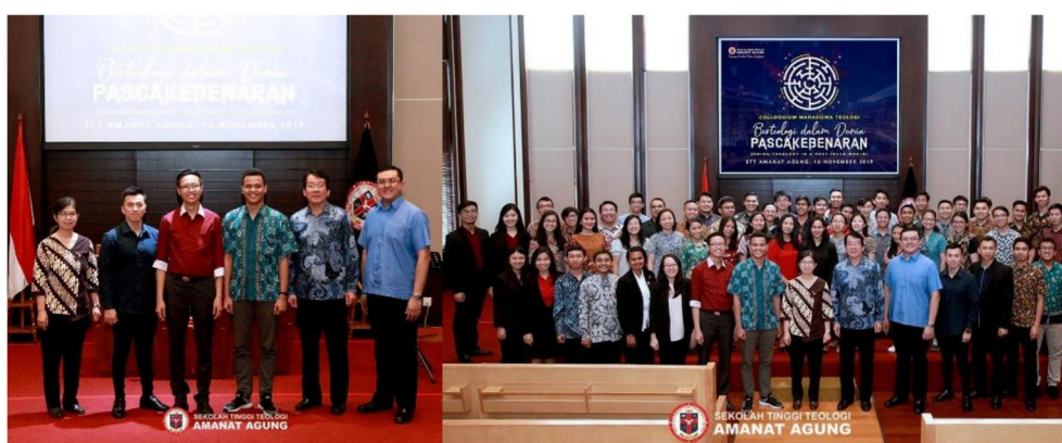
Gambar 9: LKTT ke-5