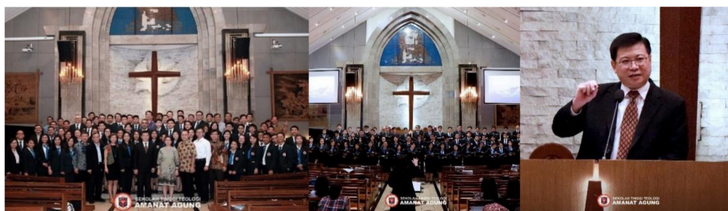
Gambar 8: Minggu STT Amanat Agung