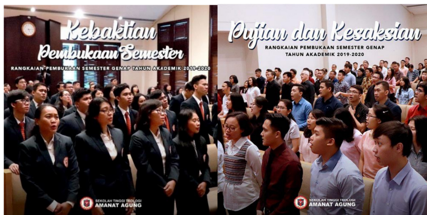
Gambar 3: Pembukaan Semester Genap 2019-2020