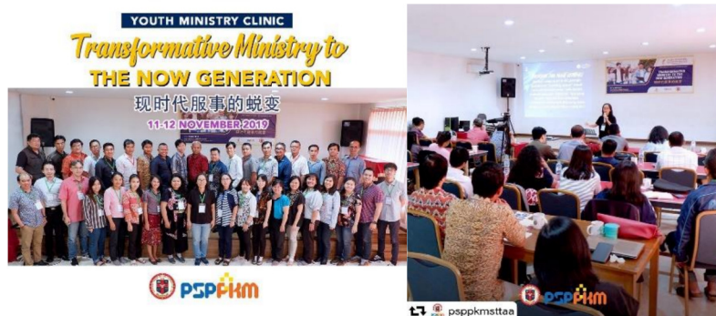
Gambar 15: Youth Ministry Clinic (YMC) di GKKB Pontianak.