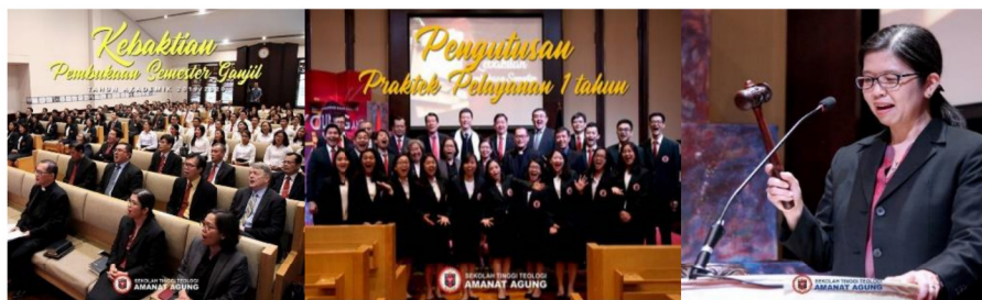
Gambar 1: Rangkaian Ibadah Pembukaan Semester Ganjil 2019/2020