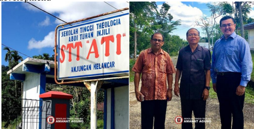
Gambar 26: Kunjungan ke STT Abdi Tuhan Ijil (ATI), Anjungan Kal-Bar