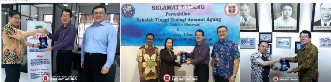
Gambar 27: Kunjungan ke Surabaya