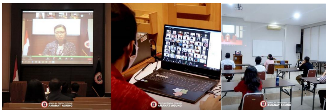
Gambar 4: Penutupan Semester Genap 2019-2020 secara daring