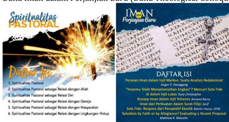
Gambar 17: Buku terbitan STT Amanat Agung

E. Emmaus Center adalah pusat belajar warga jemaat sebagai wujud pengabdian STTAA kepada masyarakat. Tahun akademik 2019/2020 ini, Emmaus Center telah menyelenggarakan beberapa kegiatan, antara lain: