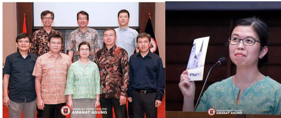
Gambar 16: Pembukaan Pusat Studi Pengembangan Gereja (PSPG)