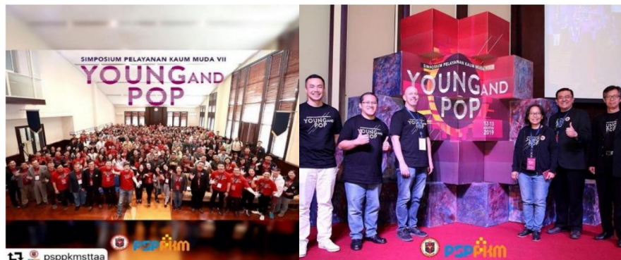
Gambar 14: Simposium Pelayanan Kaum Muda ke-7 "Young and Pop"