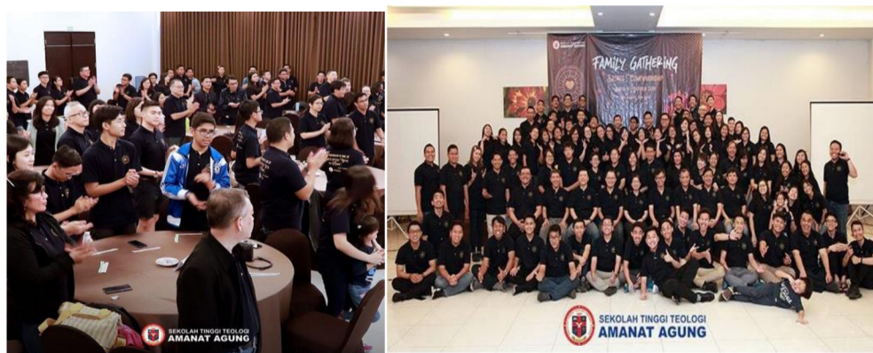
Gambar 7: Family Gathering STTAA