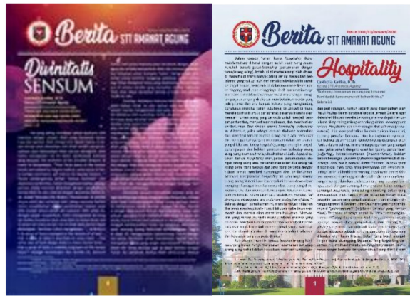
Gambar 20: Berita STTAA