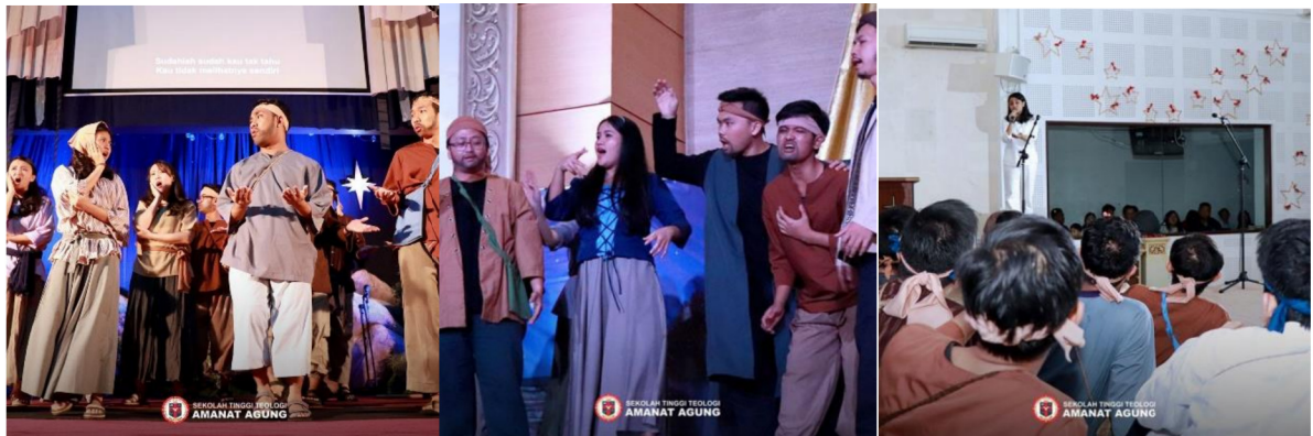
Gambar 19: Road Show Drama Musikat "Not Fear"