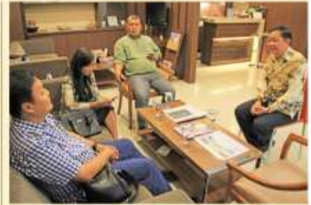
Kunjungan Misi Ecclesia Jakarta