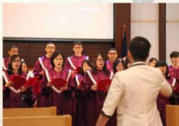
Penampilan dari Paduan Suara GKR Gedong.