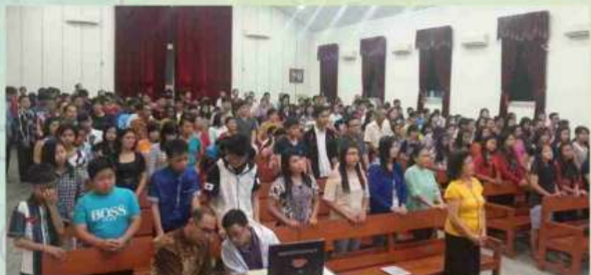
Suasana KKR kaum muda di GKKB Pemangkat.