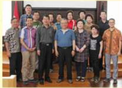
Foto bersama rombongan dari Shin Sung Presbyterian Church, Seoul, Korea Selatan.