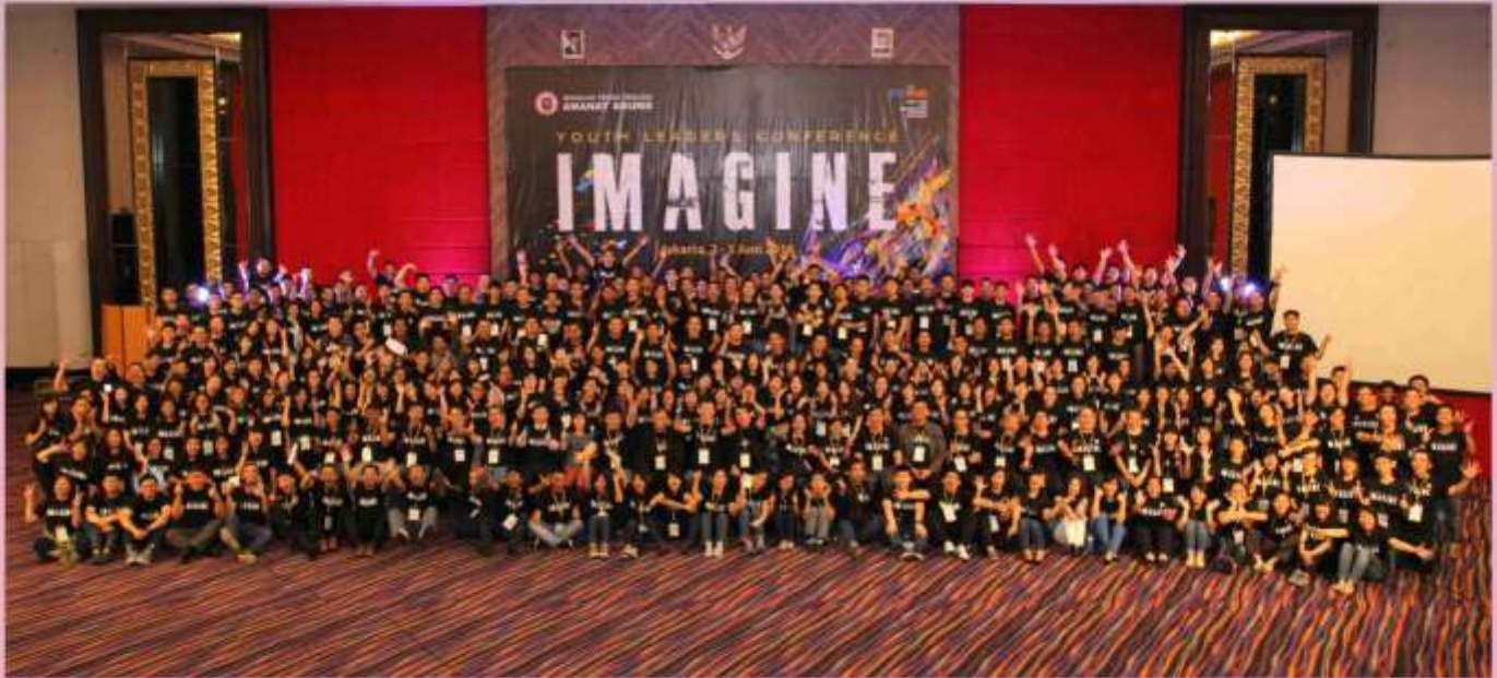
Foto bersama seluruh panitia, pembicara dan peserta dalam acara Youth Leaders Conference yang berlangsung di hotel Merlynn Park, Jakarta, 2-5 Juni 2016.