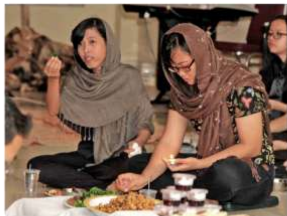
Suasana ibadah peringatan Jumat Agung.

10 Yang kukehendaki ialah mengenal Dia dan kuasa kebangkitan-Nya dan persekutuan dalam penderitaan-Nya, di mana aku menjadi serupa dengan Dia dalam kematian-Nya, 11 supaya aku akhirnya beroleh kebangkitan dari antara orang mati. (Filipi 3:10-11)