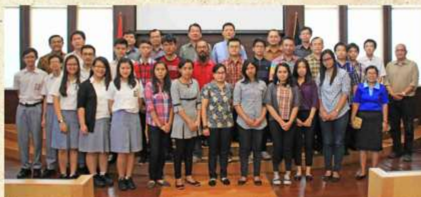
Foto bersama dosen-dosen dan seluruh peserta Open House.

Di dalam kesempatan tersebut, para peserta juga mendapatkan penjelasan berkaitan dengan proses