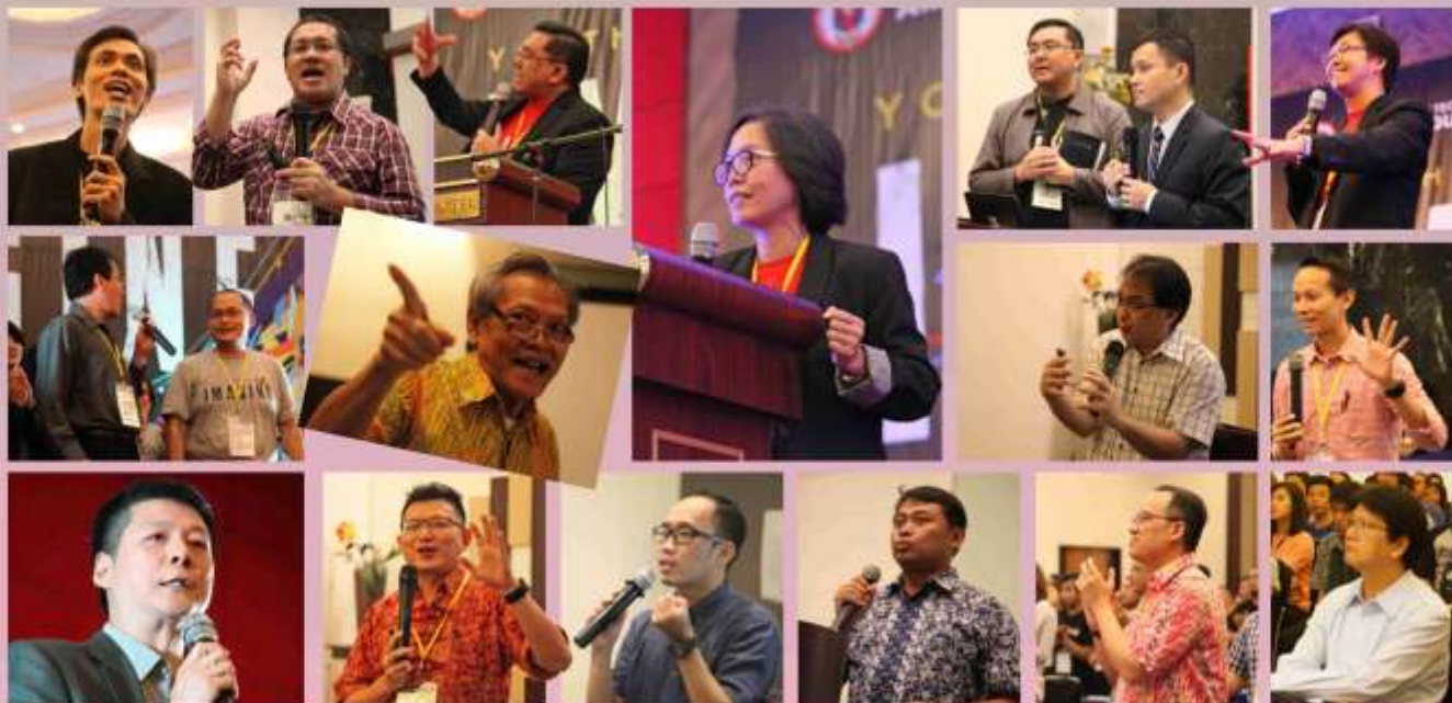
Seluruh pembicara dan nara sumber dalam Youth Leaders Conference 2016.

Panitia berterima kasih kepada semua pembicara dan nara-sumber yang telah menyumbangkan buah pikirannya dan mengucapkan selamat berkreasikan kepada para youth