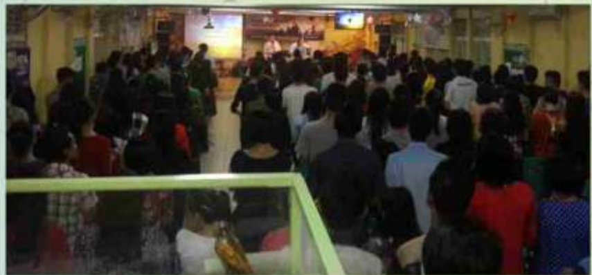
Suasana KKR kaum muda di GKKB Singkawang.