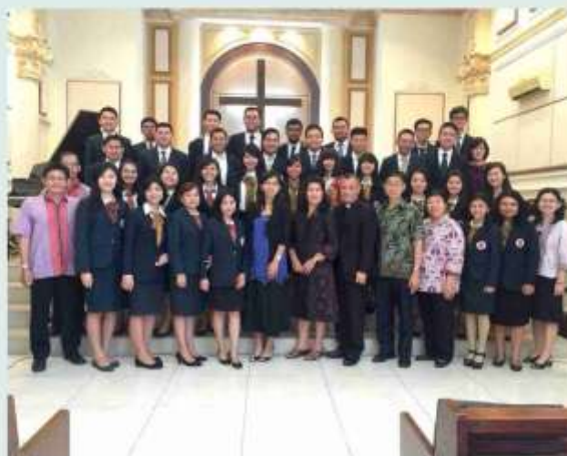
Dosen dan sebagian mahasiswa/i pada pelayanan Minggu STT.