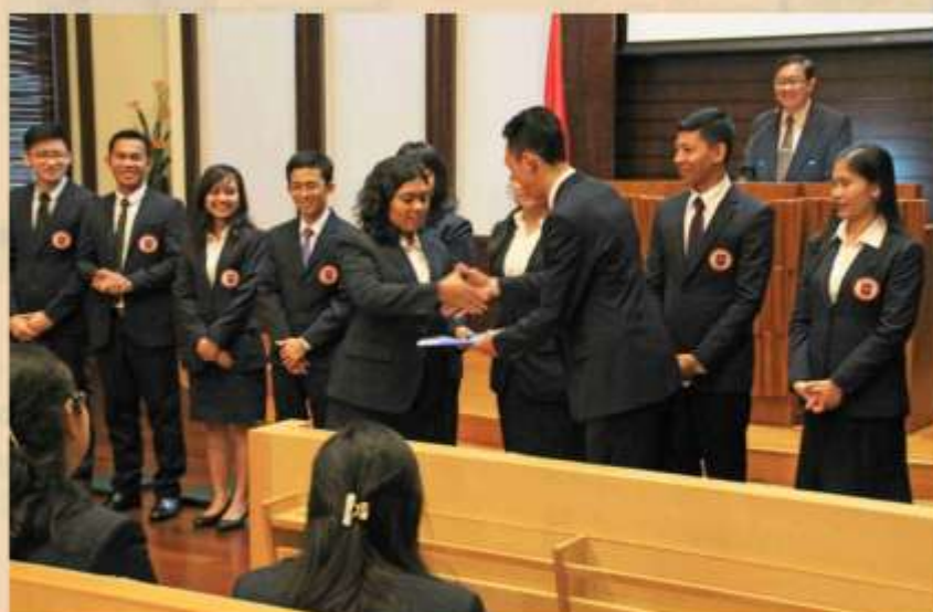
Serah terima pengurus senat lama kepada pengurus senat baru periode 2016-2017.

Di dalam kesempatan ini pula, Puket III bidang Kemahasiswaan dan Pelayanan memimpin pengutusan para mahasiswa tingkat I ke dalam praktik live-in di pedalaman Kalimantan dan para mahasiswa tingkat II dan III ke ladang praktik 2 bulan di berbagai gereja di seluruh Indonesia. Puket III juga memberhentikan dengan hormat Pengurus Senat Mahasiswa