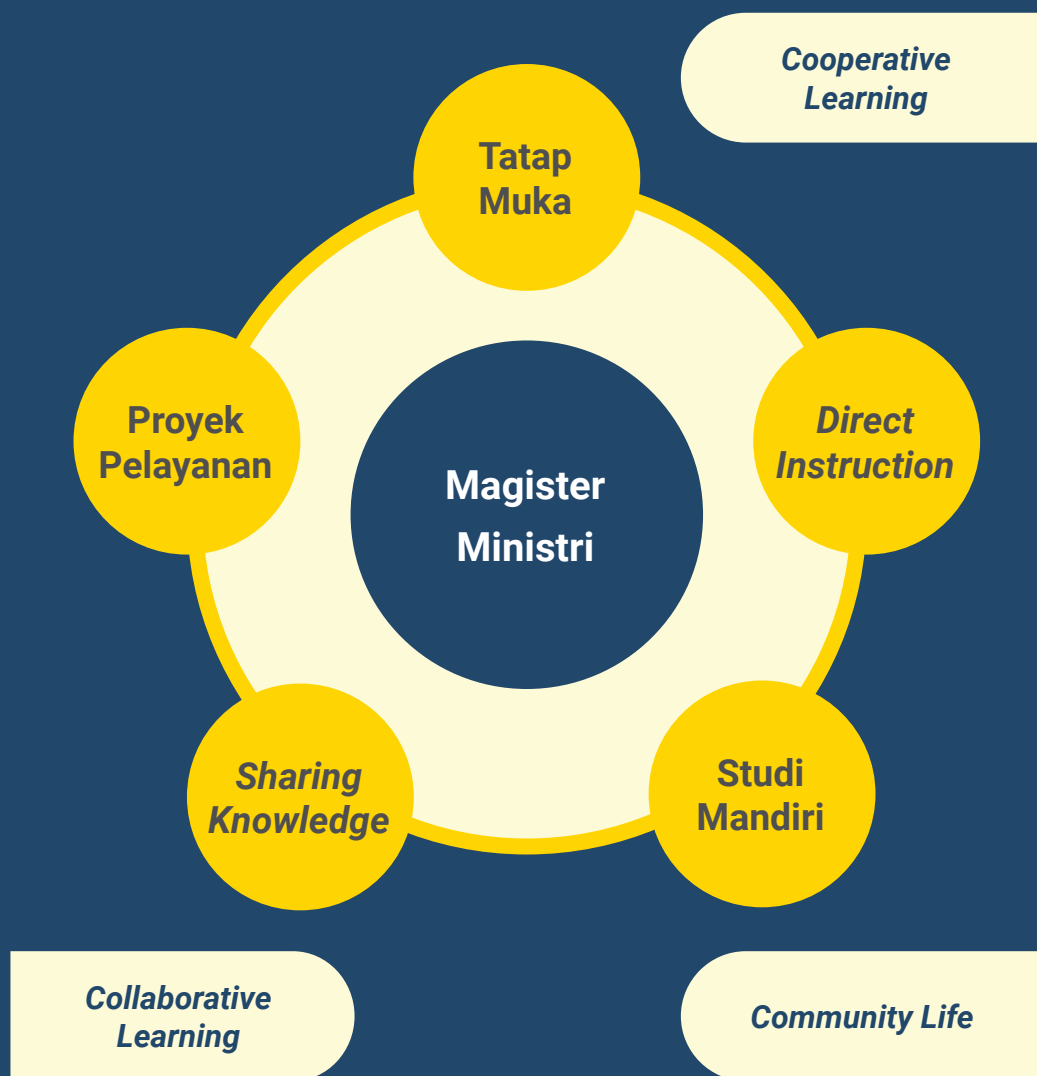
Diagram pola pembelajaran blended system untuk Magister Ministri